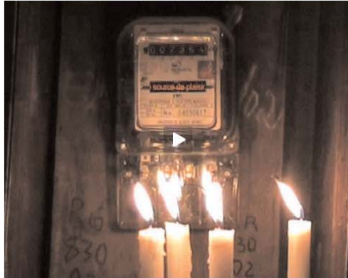
© Salifou Lindou & Christian Hanussek „Compteur oracle“, Video, 03:20 Loop, 2008

von Salifou Lindou & Christian Hanussek, doual'art, Place du Gouvernement, Bonanjo Douala B.P. 650 Douala, Kamerun, Eröffnung am Freitag, den 17. April 2009