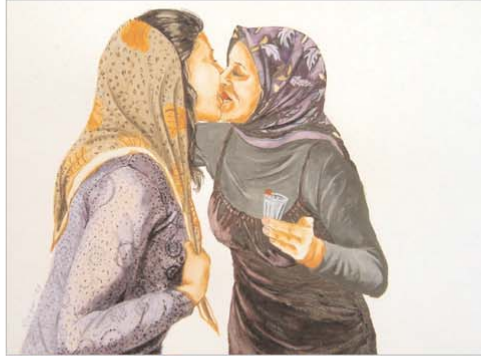
© Necla Rüzgar „Bloody Mary“, 2007, Aquarell auf Papier, 29 cm x 36 cm

von Stephanie Jünemann, Necla Rüzgar & ULTRA ART FAIR UNLIMITED, PREVIEW BERLIN – The Emerging Art Fair, Flughafen Berlin Tempelhof, Hangar2, Stand 08, Columbiadamm 10, 12101 Berlin, Eröffnung am Mittwoch, den 29. Oktober 2008, 18 – 22 Uhr (freier Eintritt)