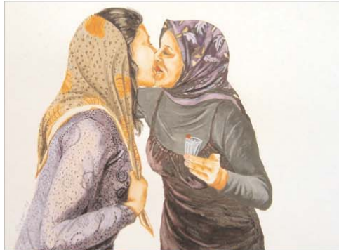
© Necla Rüzgar „Bloody Mary“, 2007, Aquarell auf Papier, 29 cm x 36 cm

von Stephanie Jünemann, Necla Rüzgar & ULTRA ART FAIR UNLIMITED, PREVIEW BERLIN – The Emerging Art Fair, Flughafen Berlin Tempelhof, Hangar2, Stand 08, Columbiadamm 10, 12101 Berlin, Eröffnung am Mittwoch, den 29. Oktober 2008, 18 – 22 Uhr (freier Eintritt)